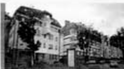
16 улиц Арзамасских.