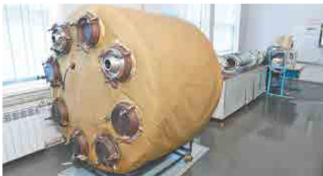
Установка проверки счетчиков газа (УПСГ).