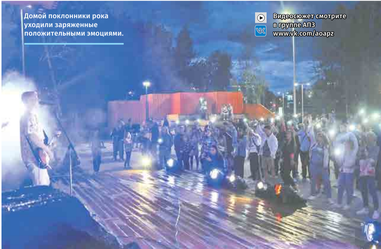
Домой поклонники рока уходили заряженные положительными эмоциями.

Видеосюжет смотрите в группе АПЗ www.vk.com/aoapz