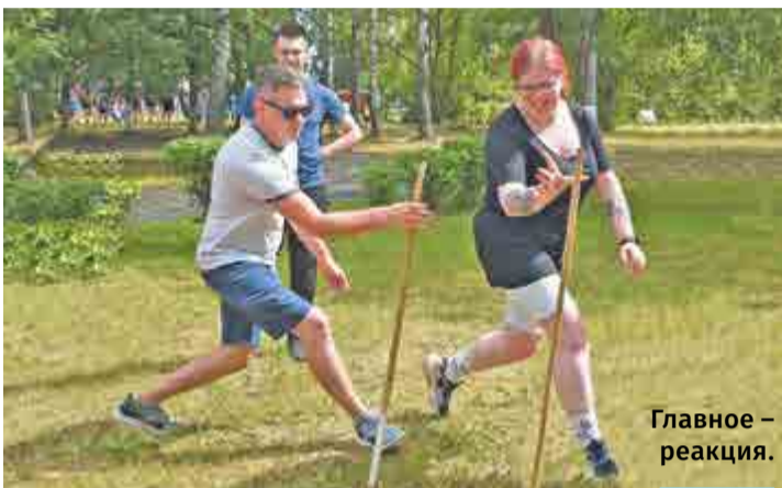
Главное – реакция.

– Только вступила в МС и сразу попала на молодежный уик-энд. Немного стеснялась вначале, но дружеская атмосфера помогла расслабиться. Понравился тимбилдинг с интересными спортивными заданиями, мы отлично повеселились. Мероприятие напомнило мне времена, проведенные в летнем лагере.