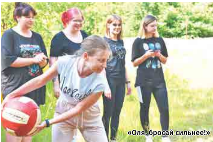
«Оля, бросай сильнее!»