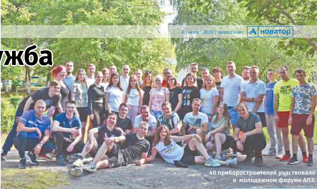
40 приборостроителей участвовало в молодежном форуме АПЗ.