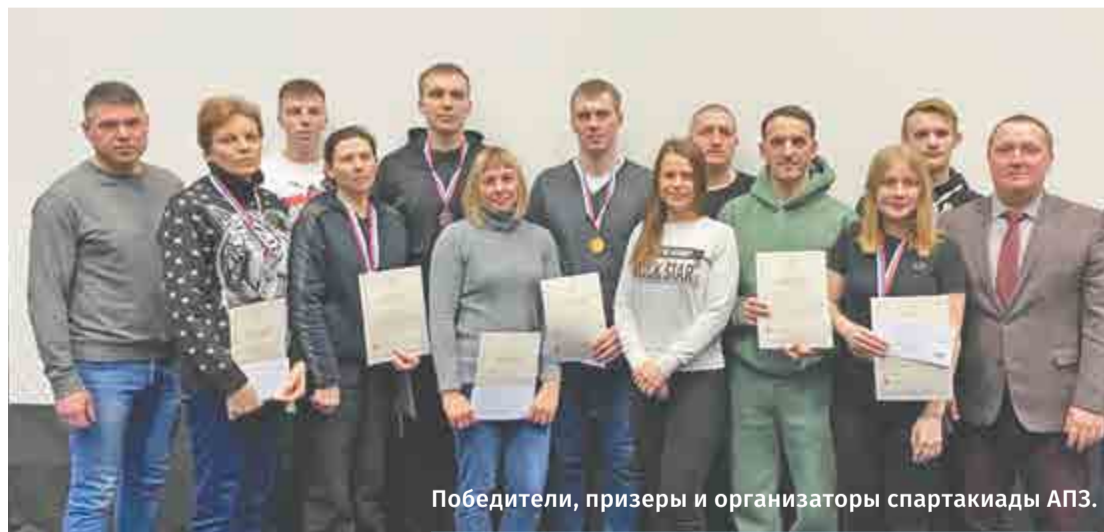
Победители, призеры и организаторы спартакиады АПЗ.