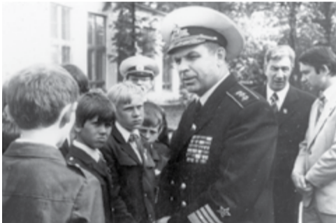
На встрече со школьниками Арзамаса, май 1981 г.

Дальше получал назначения на ответственные должности в Москве, на Северном флоте (здесь ему было присвоено звание вице-адмирала), затем снова в Москве. Служил в политуправлении Военно-морского флота, Главном политическом управлении Советской армии и Военно-морского