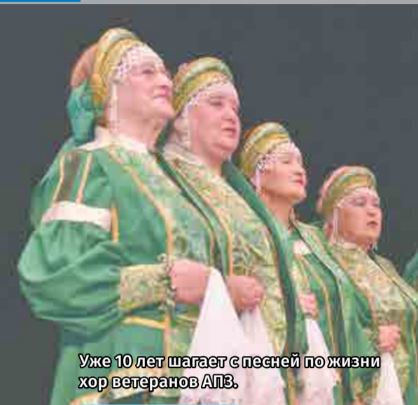
Уже 10 лет шагает с песней по жизни хор ветеранов АПЗ.