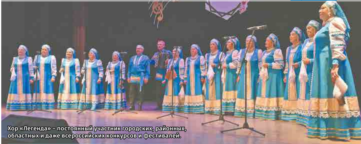
Хор «Легенда» – постоянный участник городских, районных, областных и даже всероссийских конкурсов и фестивалей.