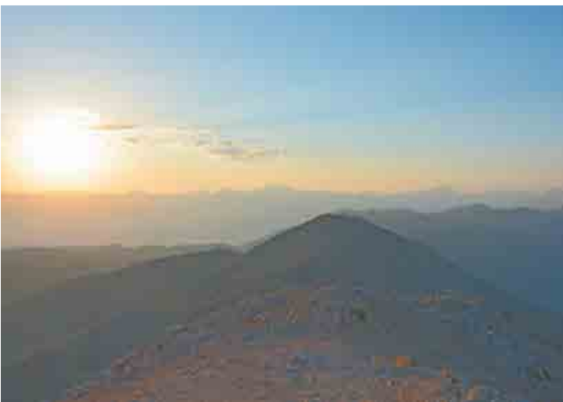
Людмила ФОКЕЕВА

Гора Тахталы на закате. Турция, 2014 год.