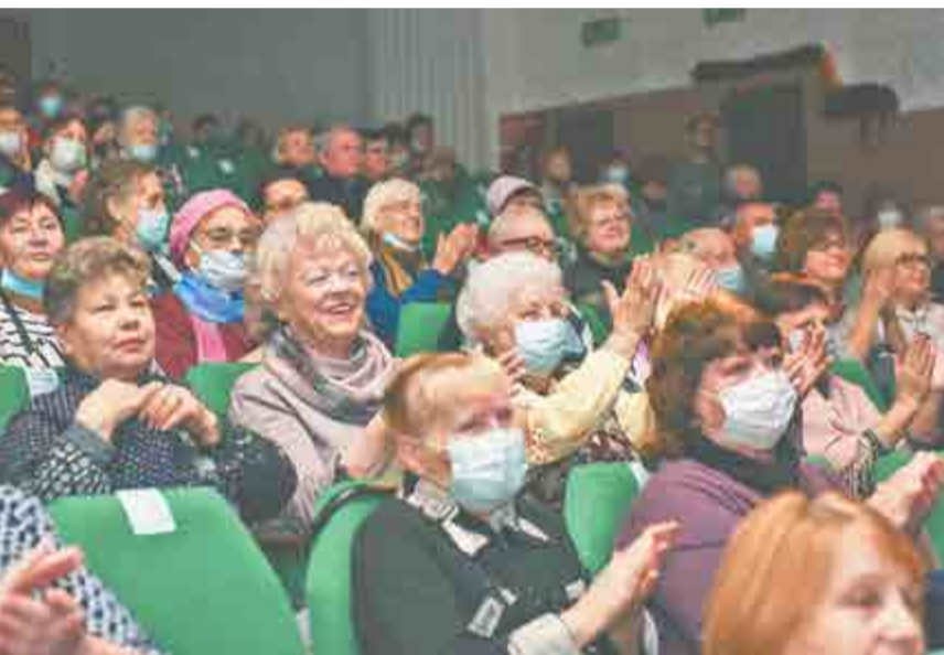
У коллектива есть настоящие поклонники. Каждый раз они с нетерпением ждут встречи с любимыми исполнителями.