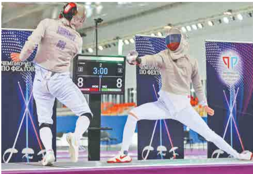
Момент финального боя.