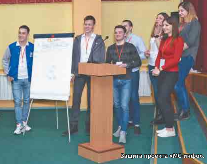
Защита проекта «МС-инфо».