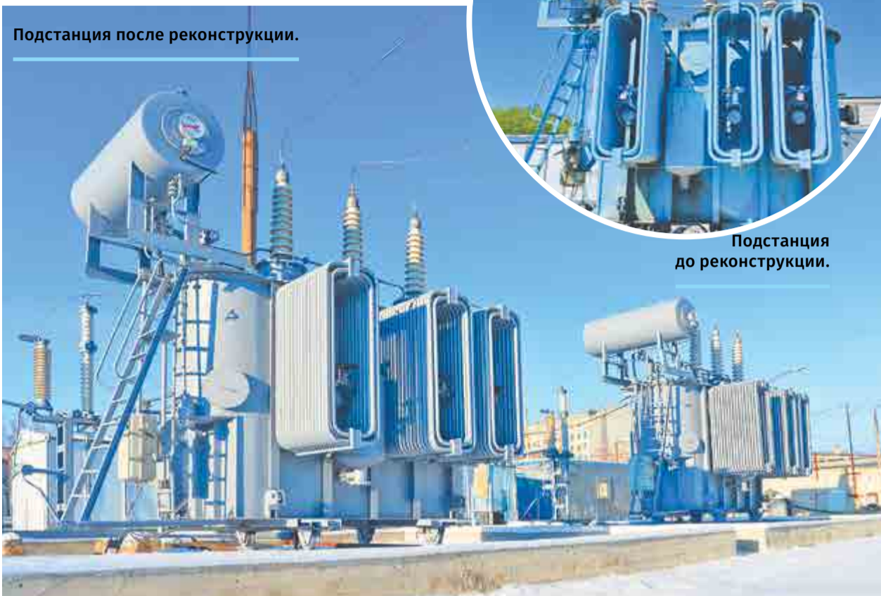
Подстанция до реконструкции.