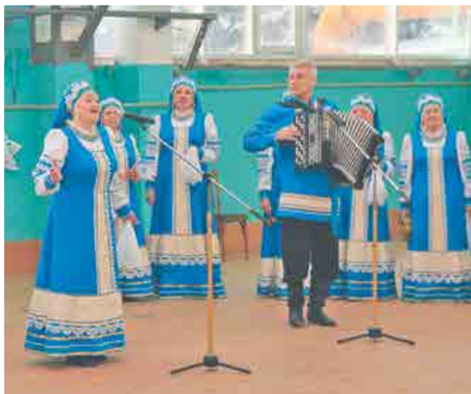
Музыкальный подарок коллективу цеха № 16 от хора ветеранов АПЗ «Легенда».

Народные и эстрадные песни, задорные частушки звучали в этот день на весь гальванический. Работники и ветераны тепло встречали заводских артистов – аплодировали, подпевали, пританцовывали. Это был добрый общий праздник всех, кто трудился и трудится в цехе №16.