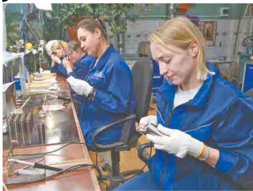
Участок обслуживания. За работой паяльщицы.

– Начну с такой истории: однажды на завод приезжали коллеги из Новосибирска, мы общались в моем кабинете, а потом я пригласил их пройти в цех. Они были очень удивлены, когда мы не выдали им респираторы и что в нашей гальванике можно свободно дышать. За последние 10 лет мы заменили практически все системы вытяжной вентиляции, перешли с металла на полипропилен. На сегодня концентрация загрязняющих веществ в воздухе рабочих зон не превышает предельно допустимых норм.