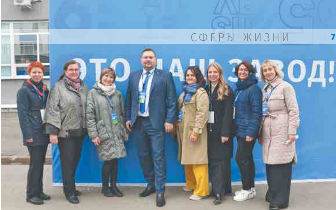
Коллектив отдела внешних связей и массовых коммуникаций на юбилее завода.

А в новый трудовой год мы постараемся по-преж-