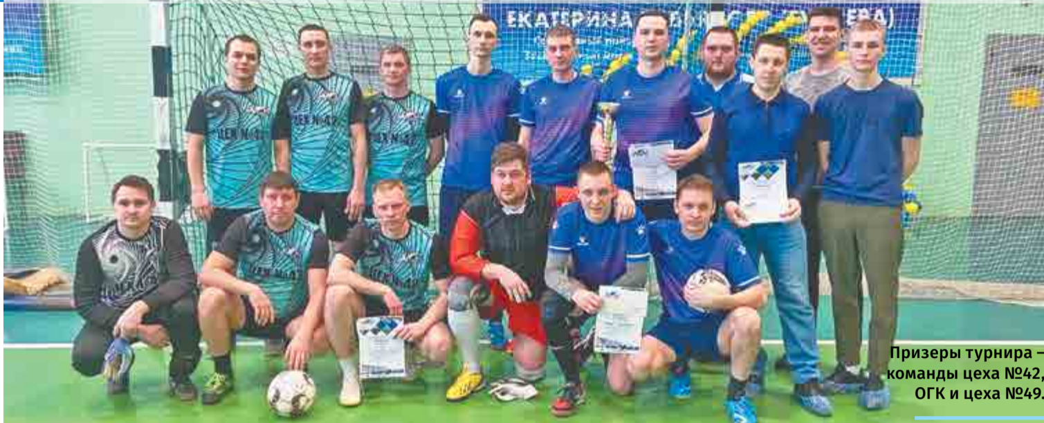
Призеры турнира – команды цеха №42, ОГК и цеха №49.