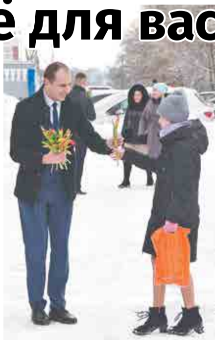
Тюльпаны к празднику.