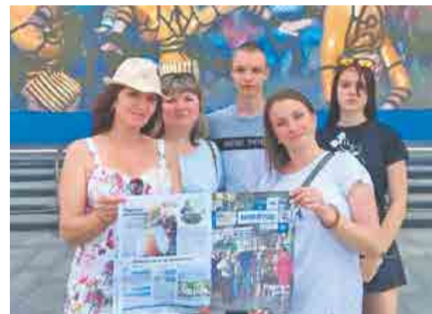
Коллектив цеха печатных плат в Центре океанографии и морской биологии «Москвариум».