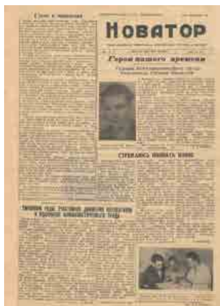
«Новатор» №1 от 4 августа 1960 года.