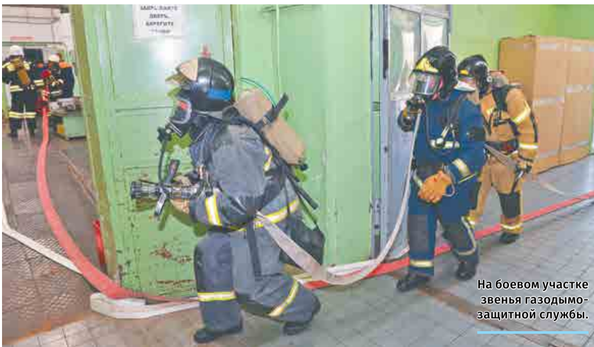
На боевом участке звенья газодымозащитной службы.

По итогам плановых учений предприятию выставлена оценка «хорошо», к работе объектового штаба пожаротушения замечаний не было.