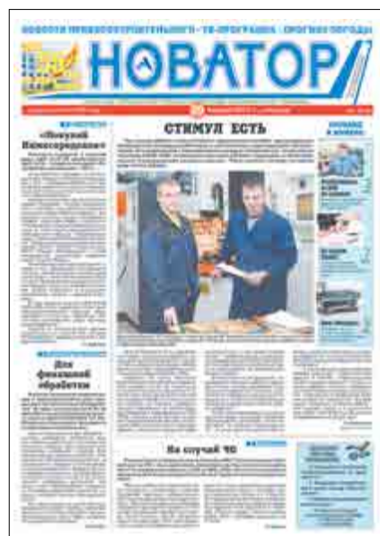
«Новатор» от 20 января 2012 года.