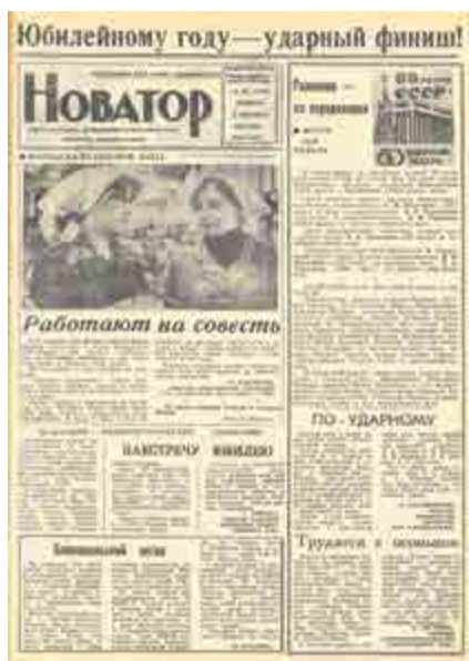
«Новатор» от 9 декабря 1982 года.