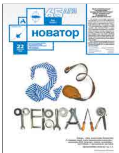
Таким был «Новатор» 22 февраля 2022 года.

Вспомнить все первополосники «Новатора» можно, заглянув на сайт предприятия в раздел «Корпоративная газета», где хранится электронный архив с 2009 года.