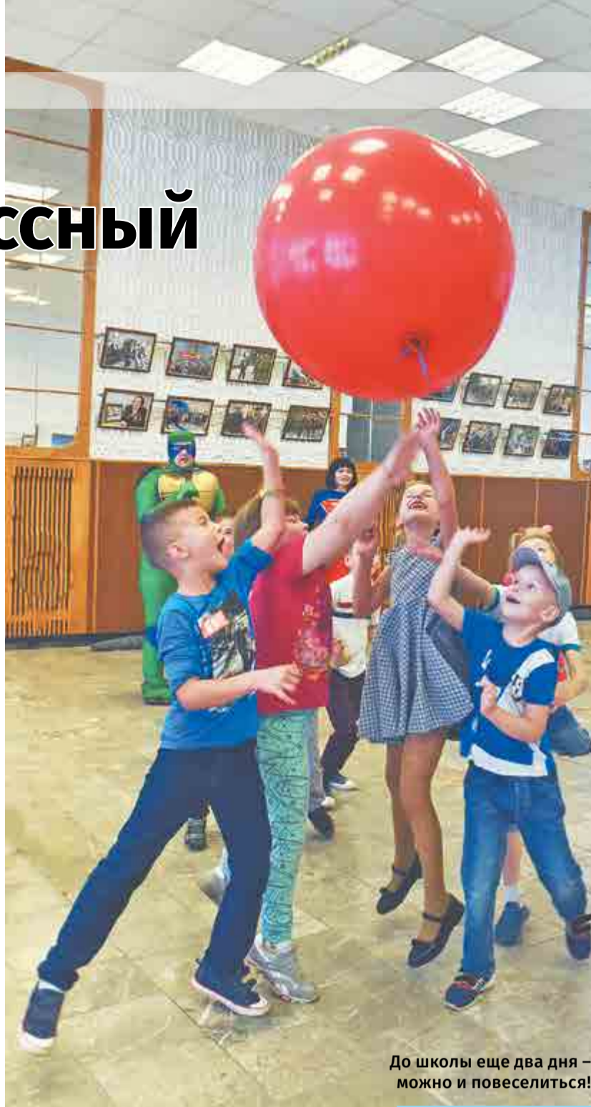
До школы еще два дня – можно и повеселиться!

детей приборостроителей пошли в этом году в первый класс.