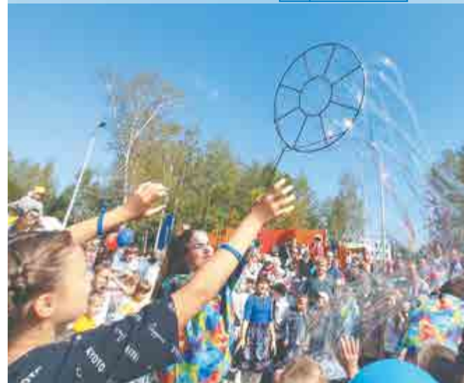
Во всех микрорайонах города были организованы праздничные программы.