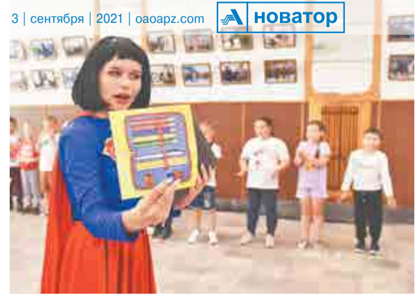
Суперурок с учителем – супергероем.