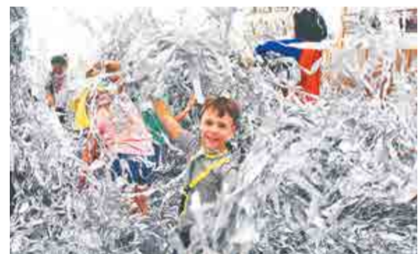
Бумажная дискотека. Вот бы перемены в школе были такими же веселыми!