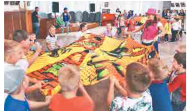
Первоклассники старательно выполняют задание Крутышки.