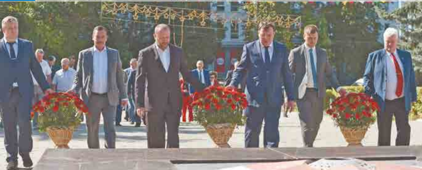
Праздничные мероприятия Дня города начались с возложения цветов к Вечному огню.