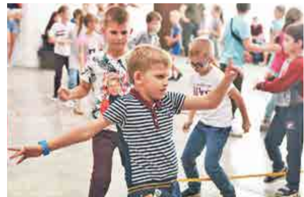
Давай танцуй! Да не стой ты зря!